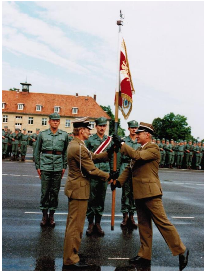
4 wrzesień 1994 r. Przekazanie obowiązków Dowódcy 1 MBA